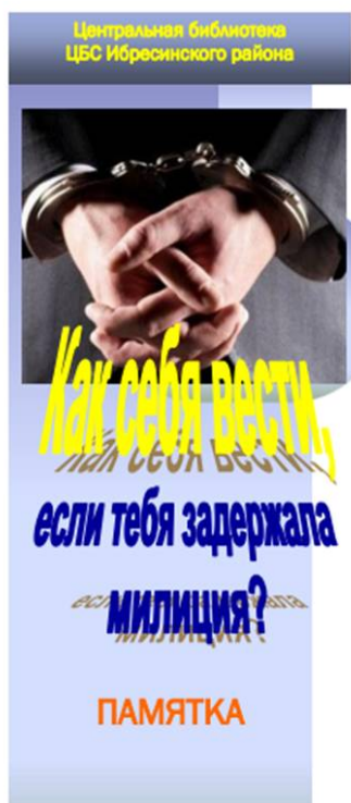
Центральная библиотека ЦБС Ибресинского района